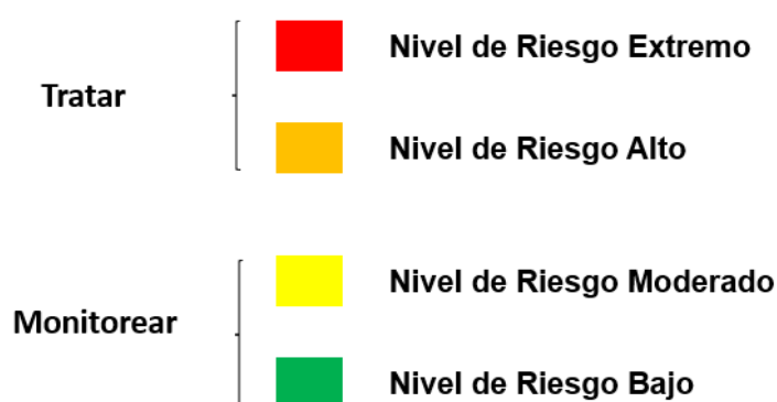
Figura N°3. Estrategias de Tratamiento Riesgos Residuales. -----

A continuación, se indican las estrategias de tratamiento que se deben tener en cuenta para gestionar los riesgos residuales: -----