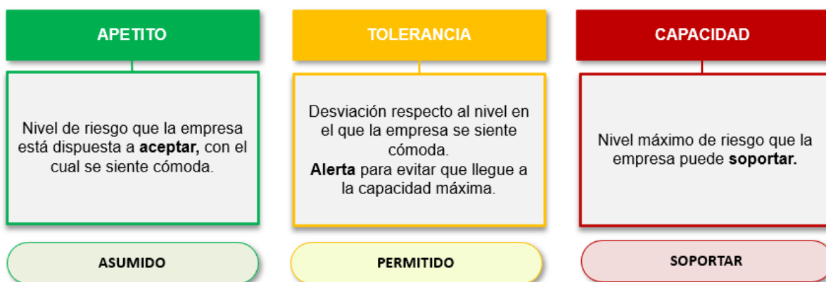
Figura N°2. Parámetros de Apetito de Riesgo de RACSA -----

El esquema de umbrales o parámetros de aceptabilidad establecidos en la Declaración de Apetito de Riesgos se identifica de la siguiente manera:-----